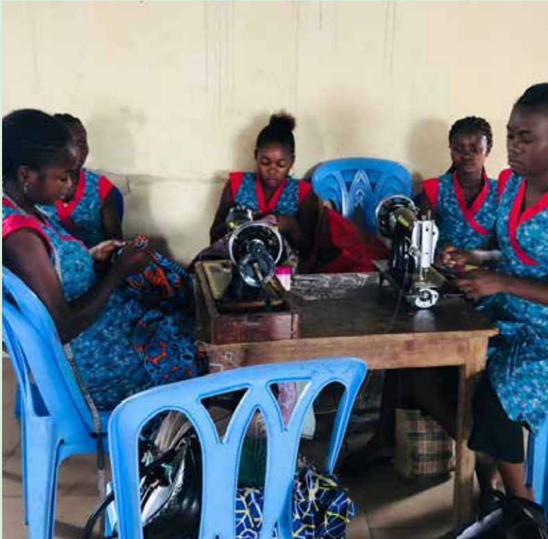
▼ Naaiatelier Saint-Camille.

In 2016 konden we slechts enkele minuten bellen met Congo zonder een astronomische telefoonrekening gepresenteerd te krijgen. Tweemaal per jaar bezochten we toen ook onze projecten om zeker te zijn dat alles goed bleef lopen. Dankzij de moderne technologie bellen we nu bijna dagelijks via internet met onze mensen in Congo. In januari konden we door de oorlog in het oosten van Congo en de bijhorende korte perikelen in Kinshasa slechts enkele parochies bezoeken.