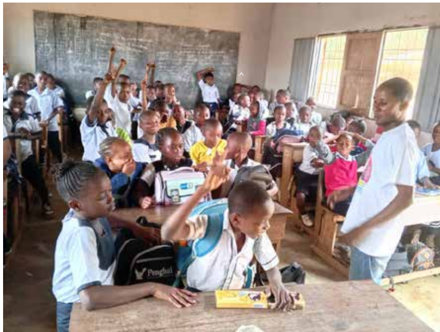
De lessen zijn al gestart.